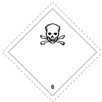
Rótulo Peligro Principal